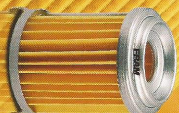
Filtro de Cartrucho

CONT: 1 PIECE - CONT: 1 PIÈCE - CONT: 1 PIEZA